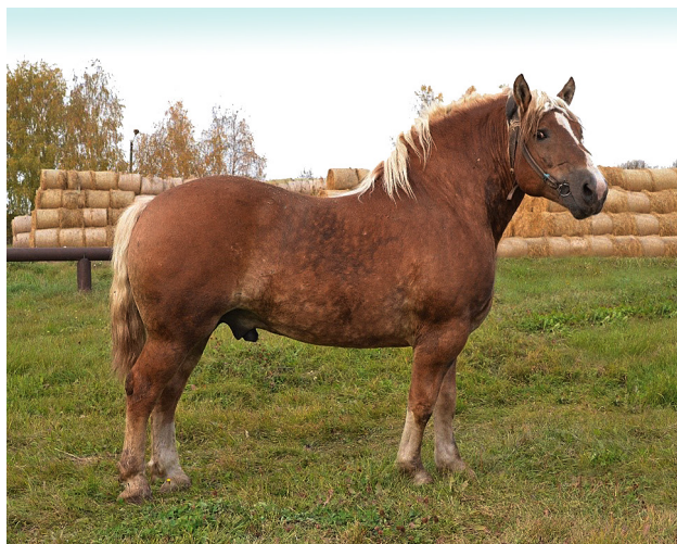
Рисунок 4 – Жеребец Бантас, св.-рыж., 2012 г. (Фанас – Баладе) литовской тяжелоупряжной породы литовской популяции

В среднем уровень наблюдаемой гетерозиготности ( H_o ) по данной выборке литовской популяции равен 0,780. Наибольшим уровнем на-