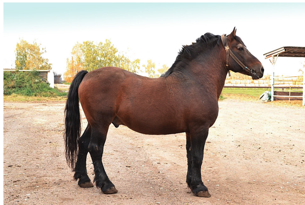
Рисунок 3 – Жеребец Жиган, гн., 2000 г. (Мирный – Жимолость) литовской тяжелоупряжной породы российской популяции

В среднем уровень наблюдаемой гетерозиготности ( H_o ) по данной выборке отечественной популяции равен 0,725 . Наибольшим уровнем наблюдаемой гетерозиготности у отечественных лошадей литовской тяжелоупряжной породы отличается локус ASB17 -0,850 , и в нем же самый высокий уровень ожидаемой гетерозиготности -0,870 .