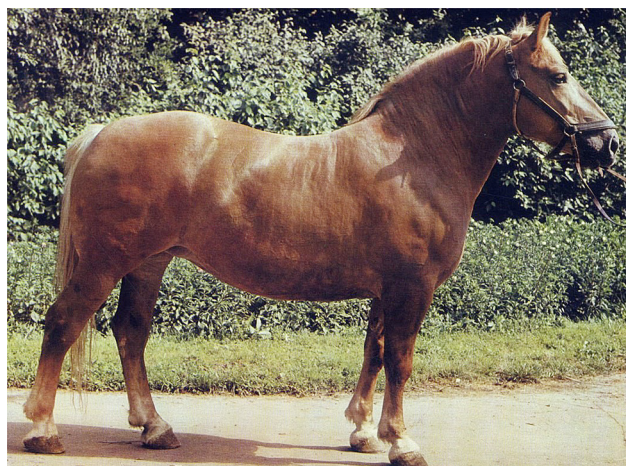
Рисунок 2 – Кобыла Лупа, рыж., 1972 г. (Бромас – Люстра) литовской тяжелоупряжной породы советского периода

Примечание: * – редкие аллели ( q < 0,05 ). Полужирным шрифтом отмечены аллели, которые есть только в данной популяции.