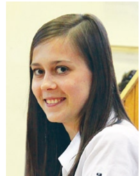
автор: Екатерина Сульдяева , студентка 3-го курса экономического факультета

Всех участников размещали по 20 человек в так называемые «двадцатки», которые состояли из предпринимателей с разных концов России. Я познакомилась с ребятами из Барнаула, которые разработали 3D-путеводитель по своему городу «На все 360». На Селигер они приехали с целью продажи франшиз, то есть для «размножения» своего бизнеса по всей стране. На Селигере они смогли получить заказ на 3D-тур по Кремлю! Также в моей «двадцатке» были успешные предприниматели из Уфы, Астрахани, Калининграда. За 9 дней мы узнали друг друга поближе, поделились опы-