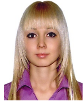
автор: Мария Каишинская, студентка 5-го курса факультета энергетики и электрификации

факультете энергетики и электрификации, выбрал курсы по немецкому языку в технической области. За время обучения в вузе я узнал очень много нового о Германии, побывал на многих промышленных предприятиях в городе Аахен и в соседних городах, в общем, получил хороший опыт и обширные знания в своей специальности. В частности, на занятиях мы изучали перспективные проекты в области возобновляемой энергии: ветряных и биогазовых установок. Наша группа состояла из студентов из разных стран (Франции, Италии, Испании, Бразилии и др.), поэтому общались мы только на немецком языке. В свободное от занятий время по программе было запланировано множество экскурсий: посещение театра, кинотеатра, бассейна, аквапарка и т.д. Нам не