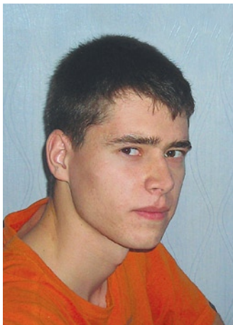
автор: Юрий Любимов , студент 5-го курса факультета энергетики и электрификации

Что жизнь моя? Сплошная череда Ошибок, проб, нелепых оправданий. Как волны размывают берега, Как разбиваются, безумные, о камень.