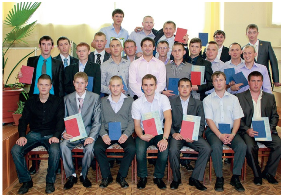
На фото: выпускники агроинженерного факультета

• В числе приоритетных задач – разработка долгосрочного плана развития учхоза «Июльское» на основе договора о сотрудничестве с академией, направленной на улучшение производственных показателей учхоза и обеспечение практической подготовки студентов академии.