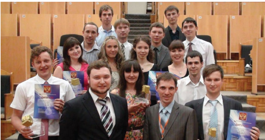
На фото: победители второго республиканского конкурса инновационных проектов по программе «УМНИК»

Материал подготовлен с использованием информации и фото с официального сайта Фонда содействия развития малых форм предприятий в научно-технической сфере в УР.