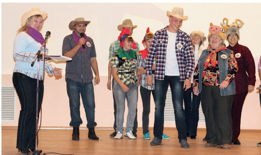
На фото: команда зооинженерного факультета

...Яркие декорации, ковбойские шляпы, клетчатые рубашки, разноцветные кланы и мягкая кантри-музыка... Невольно окунаешься с головой в атмосферу Дикого Запада! Вот так нас встречали на Дне куратора! Кругом гитары, громкий смех, множество ярких и радостных студентов, которым ничуть не уступали ни в стиле, ни в активности преподаватели-кураторы групп! Имен-