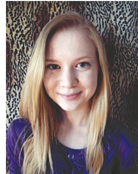
автор: Александра Стяжкина , студентка 1-го курса факультета ветеринарной медицины

Проходили годы, мне всё больше и больше хотелось уже окончить школу и стать ветеринарным врачом. Временами было очень сложно идти к поставленной цели. Были и те, кто смеялся над моим