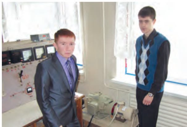
автор: Юрий Любимов , студент 4-го курса факультета электрификации и автоматизации сельского хозяйства

Впервые с установкой «Асинхронный электродвигатель, переведённый в режим генератора» познакомились на дисциплине «Электрические машины», когда выполняли лабораторную работу. О том, что установка экспериментальная, узнали позже, когда приступили к научной работе по этой теме. Заведующий кафедрой электрических машин, к.т.н., доцент В.А. Носков – один из авторов работы и её главный